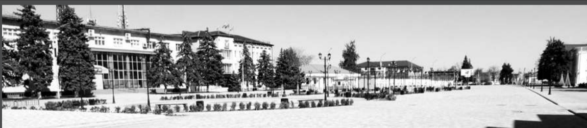
Тимашевск, 2 апреля 2020 года. Полдень, пустынная центральная площадь – карантин.

COVID-19. Пандемия. Карантин. Ограничительные меры... Администрация Тимашевска вынуждена была на ходу перестраивать свою работу под условия, в которых никто из ныне живущих никогда не был. Требовалось не просто организовать надлежащее жизнеобеспечение города, но и принять комплекс мер для предотвращения распространения коронавируса на подведомственных территориях. А ещё обеспечить в городе голосование по Конституции, по выборам депутатов райсовета и так далее. Большой объем работы выпал и на долю первых помощников администрации – председателей ТОСов и квартальных.