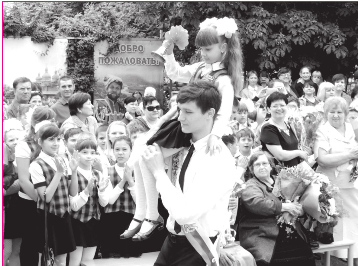
НА СНИМКЕ: последний звонок в Тимашевской городской средней школе №5. 2016 г.

Но так как обо всех этих изменениях стало известно не в начале учебного года, а в середине – ребятам сейчас дается больше времени для того, чтобы скорректировать свой выбор – сдавать им ЕГЭ или все-таки ГВЭ.