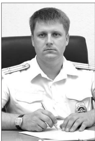
В Тимашевском районе проводятся профилактические мероп-

приятия по безопасности дорожного движения.