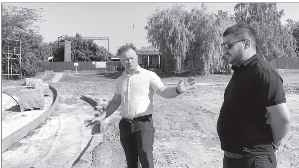
БЛАГОУСТРОЙСТВО ТЕРРИТОРИИ: городской пляж, ул. Кузнечная, 127.