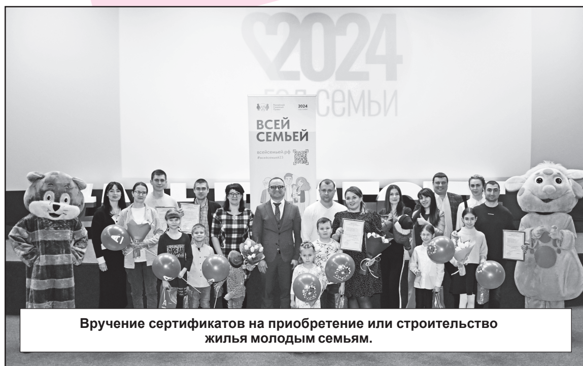
Вручение сертификатов на приобретение или строительство жилья молодым семьям.