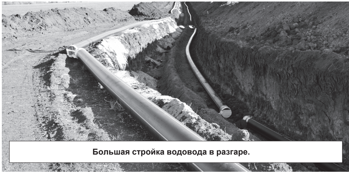
Большая стройка водовода в разгаре.