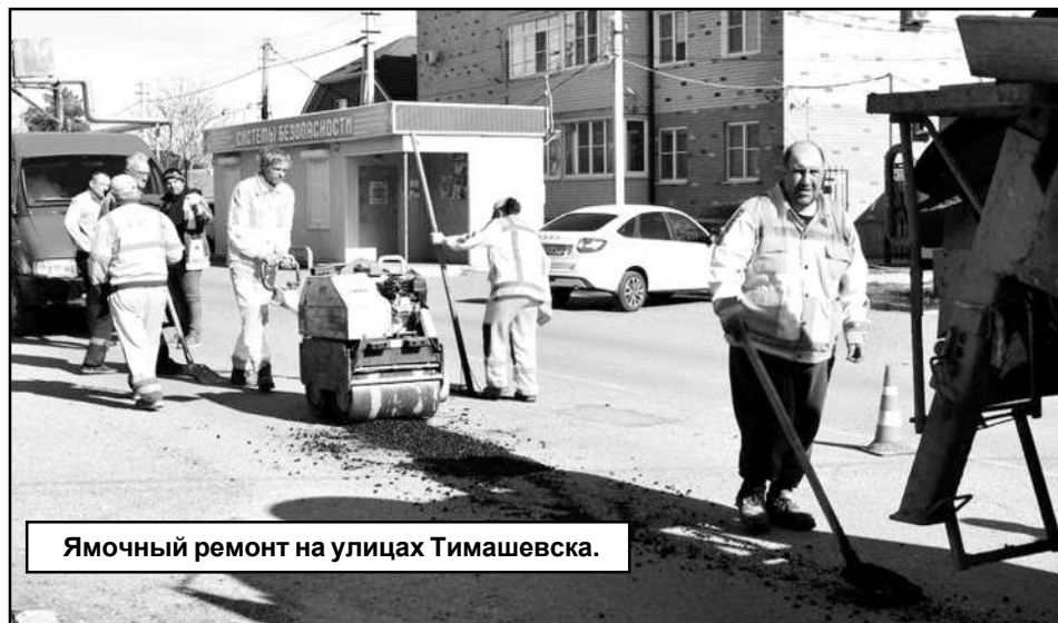
Ямочный ремонт на улицах Тимашевска.