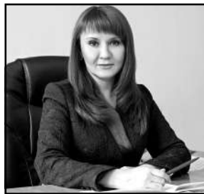
Светлана БЕССАРАБ, депутат Государственной Думы, член штаба Регионального отделения Народного фронта в Краснодарском крае.

В 2024 году на подключение домов льготников к газовым сетям из федерального бюджета дополнительно будет направлено 1 миллиард рублей.