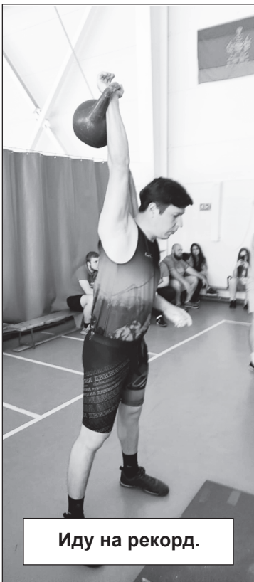
Иду на рекорд.

Вот и закончилась XIX городская спартакиада трудовых коллективов Тимашевска, с ходом которой в этом году «Антиспрут» постарался знакомить своих читателей. Длилась спартакиада с 6 апреля по 1 июня, и завершилась баскетбольным поединком, в котором заслуженную победу одержала команда «Образование».