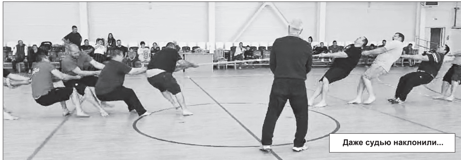
Даже судью наклонили...

Интересно, что этих спортсменов никто не уговаривал прийти на соревнования. Напротив, руководство данных коллективов само, что называется, вышло на организаторов городской спартакиады с просьбой зачислить их в список участников и выяснить организационные усло-