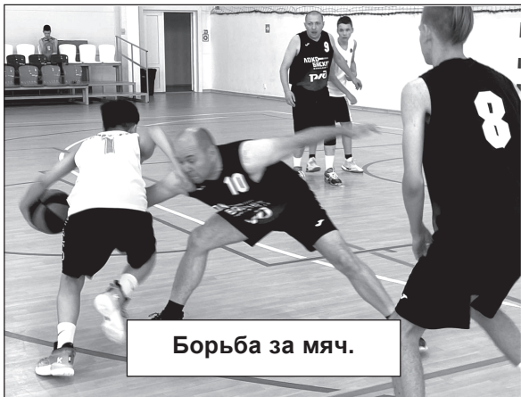
Борьба за мяч.