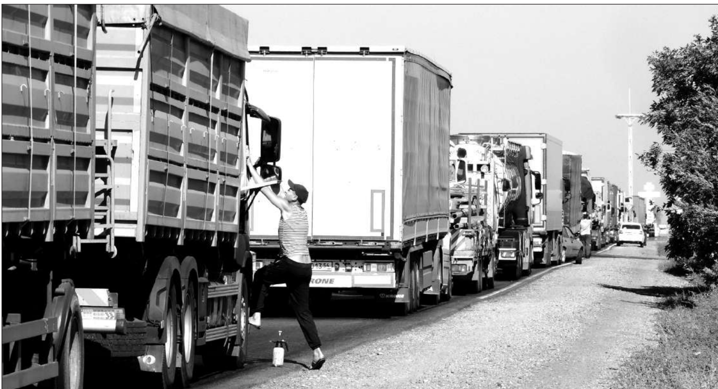
НА СНИМКЕ: автопробка в городе Тимашевске на подъезде к ЖД переезду, улица Промышленная: у водителя есть время помыть стёкла своего большегруза. Впереди ещё не переезд, а только кольцевая развязка и поклонный крест с надписью «Спаси и сохрани»... 7 октября 2020 г.