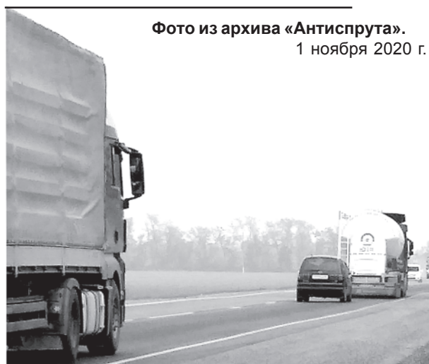
1 ноября 2020 г.