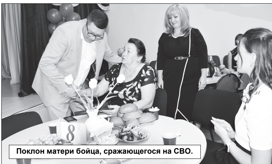
Поклон матери бойца, сражающегося на СВО.