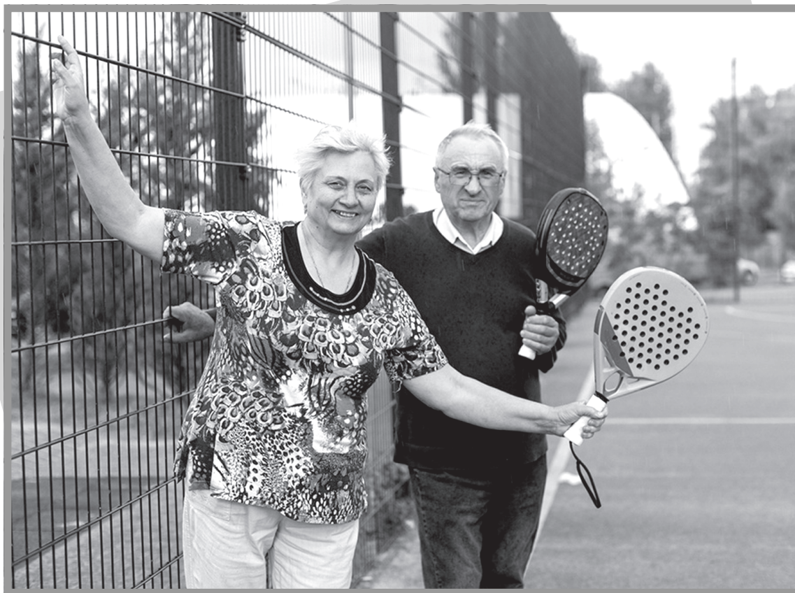
То, как скоро появятся новые болезни, – зависит от образа жизни.

Генетика решает многое. Но даже если человеку «не повезло» с наследственностью, во многих случаях справится современная медицина. Например, если у человека наследственная гиперхолестеринемия и зашкаливает уровень «плохого» холестерина (а это значит, что неизбежен ранний атеросклероз, инфаркт или инсульт), поможет специфическая терапия. «Современные лекарства помогут держать уровень липопротеи-