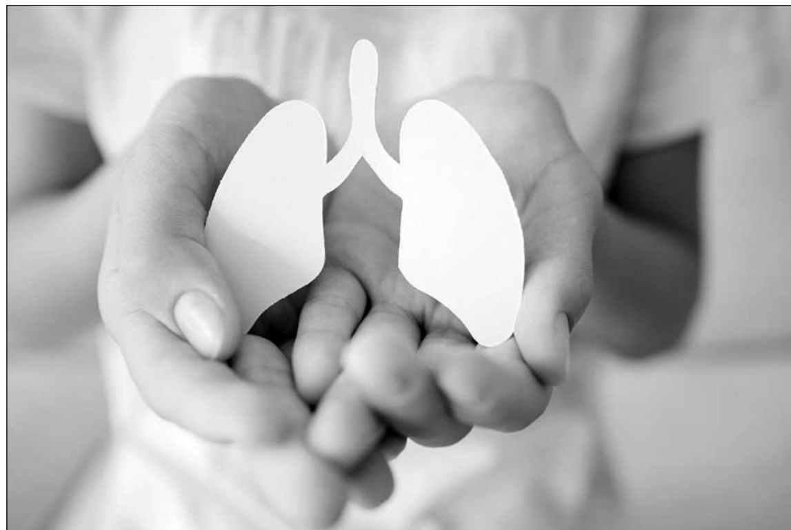
Чтобы выбрать правильную стратегию – необходимо обратиться к врачу.