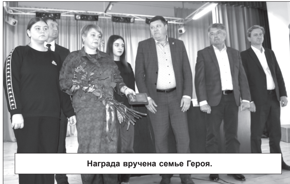
Награда вручена семье Героя.