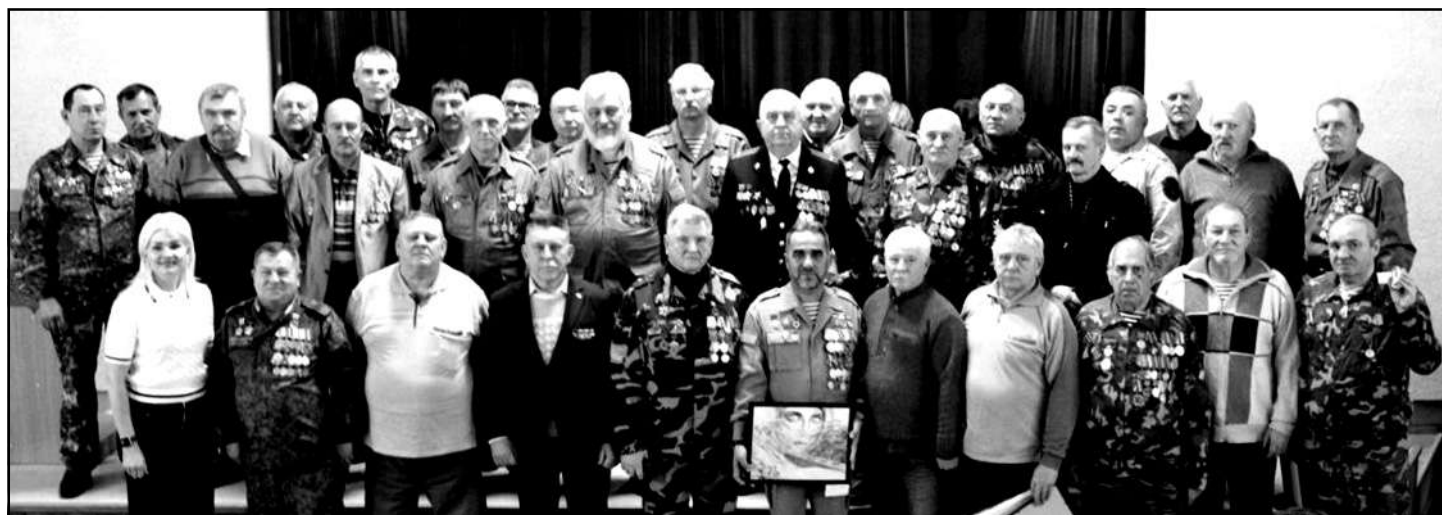
НА СНИМКЕ: фото на память.