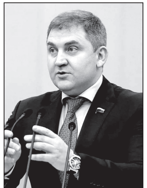
НА СНИМКЕ: депутат Государственной Думы ФС РФ Дмитрий Ламейкин.