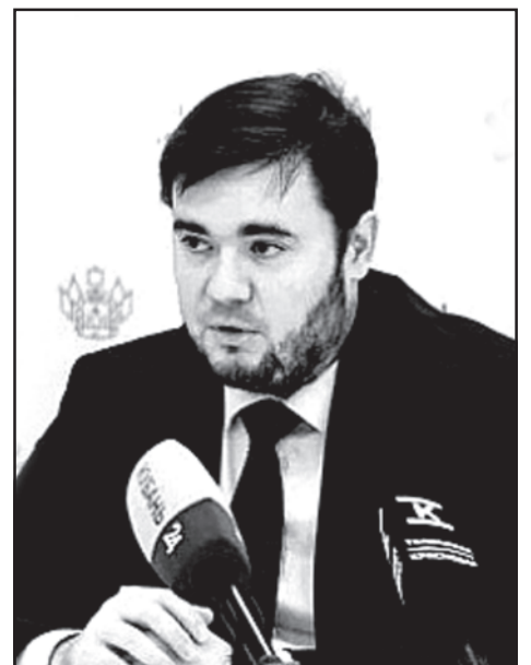
НА СНИМКЕ: вице-губернатор Краснодарского края Александр Топалов.

С видеообращением к тимашевцам обратилась временно исполняющая полномочия главы города Стаханов Луганской Народной Республики Наталья Жулинская.