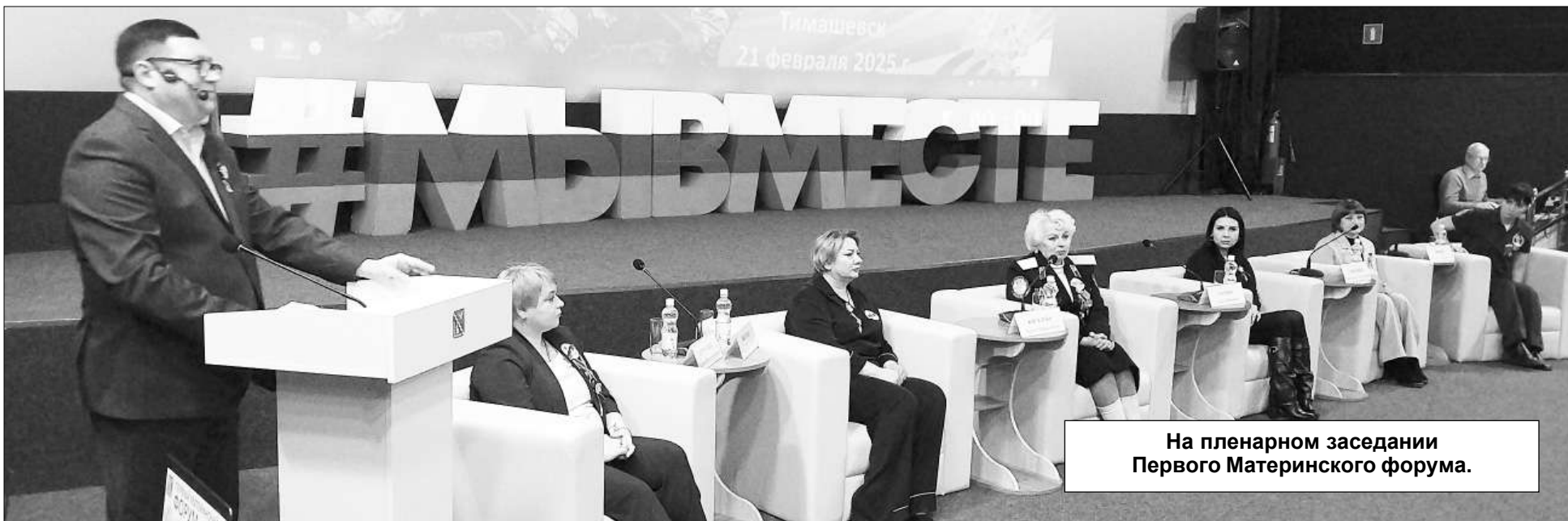
На пленарном заседании Первого Материнского форума.