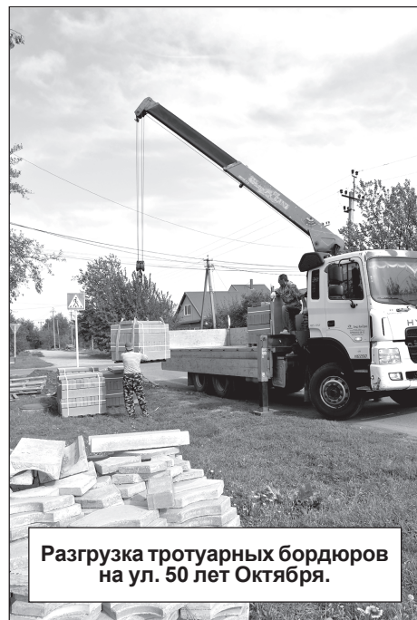
Разгрузка тротуарных бордюров на ул. 50 лет Октября.

С таким огромным по объему тротуарным строительством в нашем городе мог потягаться разве что новый тротуар на улице Весовой, что в микрорайоне Индустриальном. В этом месте, связывающим через дамбу центр микрорайона с его дальней южной окраиной, до 2024 года тротуара вообще не было. Школьникам и другим пешеходам приходилось идти по краю проезжей части и без того не очень гладкой, скажем так, дороги. Теперь это всё в прошлом, так сказать, достояние истории.