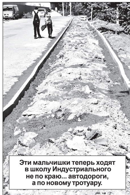
Эти мальчишки теперь ходят в школу Индустриального не по краю... автодороги, а по новому тротуару.