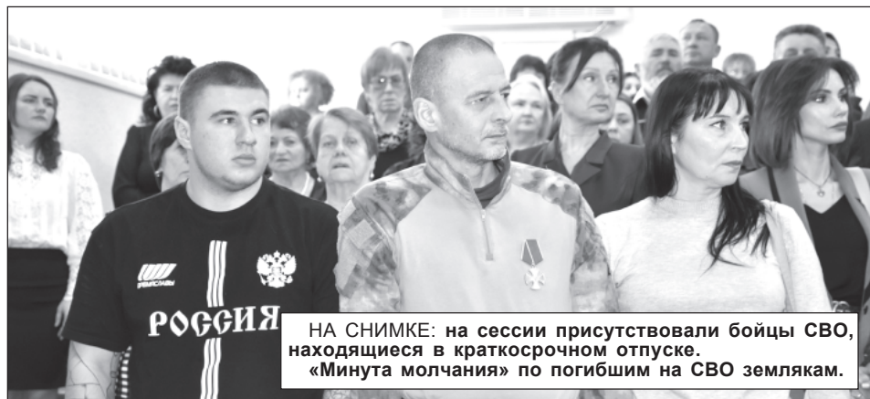
НА СНИМКЕ: на сессии присутствовали бойцы СВО, находящиеся в краткосрочном отпуске. «Минута молчания» по погибшим на СВО землякам.

ние и ремонт сетей уличного освещения. Кроме того в отчетном году при возникновении аварийной ситуации в мкр. Сахарный завод оперативно приобретены 2 новых силовых трансформатора.