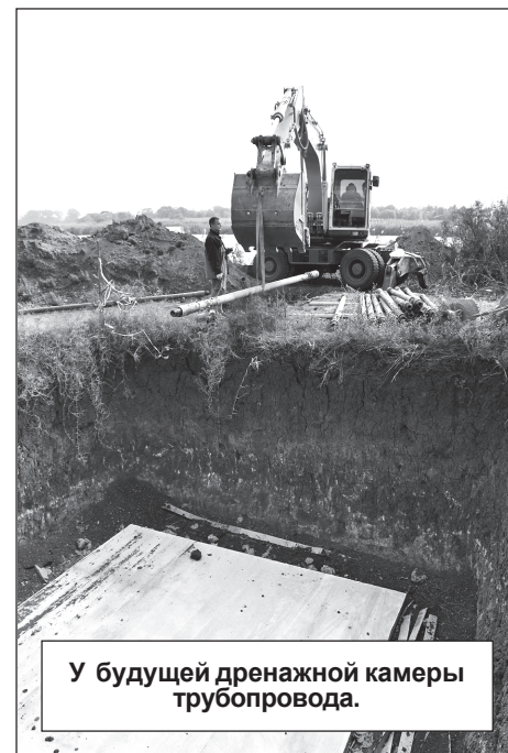
У будущей дренажной камеры трубопровода.